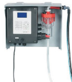
TP5W - Wandgerät kombinierbar mit beliebigem Sammelbehälter oder Kühlschrank