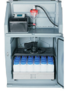
SP5B - Kompaktgerät im Kunststoffgehäuse für hohe Umgebungstemperaturen