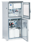
SP Zone 2 Edelstahlgerät