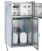
SP Zone 1 - Edelstahlgerät