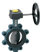
Absperriklappe mit Handgetriebe